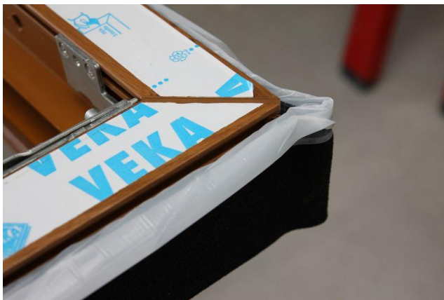
roh (montáž na tupo)