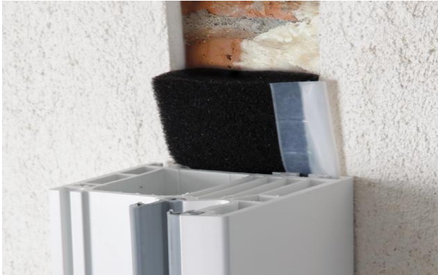
roh (montáž v jednom kuse)